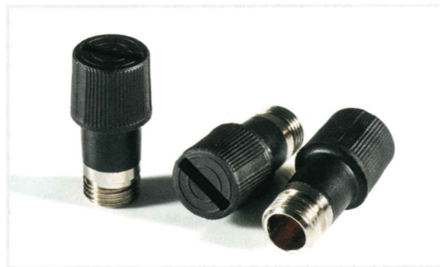
Bild 1. Sicherungsträger müssen flammgeschützt werden. Reiher verwendet für seine Modelle ein mit rotem Phosphor flammgeschütztes, mit 25 % Glasfasern verstärktes PA 66

Eine Konditionierung der gespritzten Probestäbe im Normalklima (23 °C, Luftfeuchtigkeit 50 %) im Klimaschrank wurde direkt nach der Herstellung vorgenommen. Für die normgerechte Bewertung eines PA ist die Angabe eines definierten Feuchtegehalts notwendig. Unterschieden wird zwischen den Zuständen trocken (Lagerung bis 0,2 Gew.-% Wasser), luftfeucht (Lagerung bei 23 °C und 50 % relative Feuchte bis 2,7 Gew.-% Wasser) und feucht (Lagerung in Wasser bis 7,2 Gew.-% Wasser) [6]. Das Ziel der Untersuchung war jedoch nicht, einen normierten Wert zu ermitteln, sondern die Vergleichbarkeit der Chargen zu gewährleisten. Die Chargen wurden in einem undefinierten, aber untereinander vergleichbaren Zustand geprüft. Eine identische Verweilzeit aller Proben im Normalklima wurde eingehalten. »