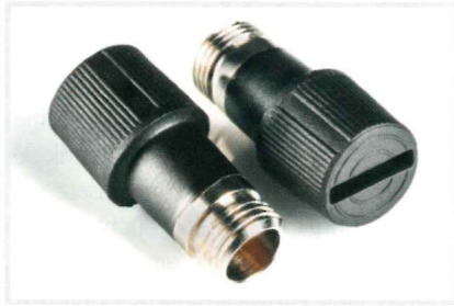
Bild 3. Sicherungshalter hergestellt mit rückgeführten Produktionsabfällen: Die Zugabe des Recyclingmaterials verringert die Eigenschaften der Bauteile nur unerheblich

Das Brennverhalten wurde in Anlehnung an die DIN EN ISO 9773 untersucht. Dabei werden in einem Brandkasten jeweils fünf Probekörper mit den Maßen 15 mm x 140 mm x 2 mm in definierter Art und Weise einer Gasflamme ausgesetzt. Die Klassifizierung in Brennbarkeitsklassen erfolgt durch Bewertung der Nachbrenn- und Nachglühzeit sowie des brennenden Abtropfens des Probekörpers.